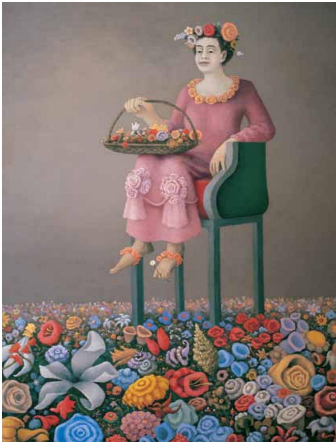
7. FLÓRA ASSZONY 110 x 85 cm, 1999