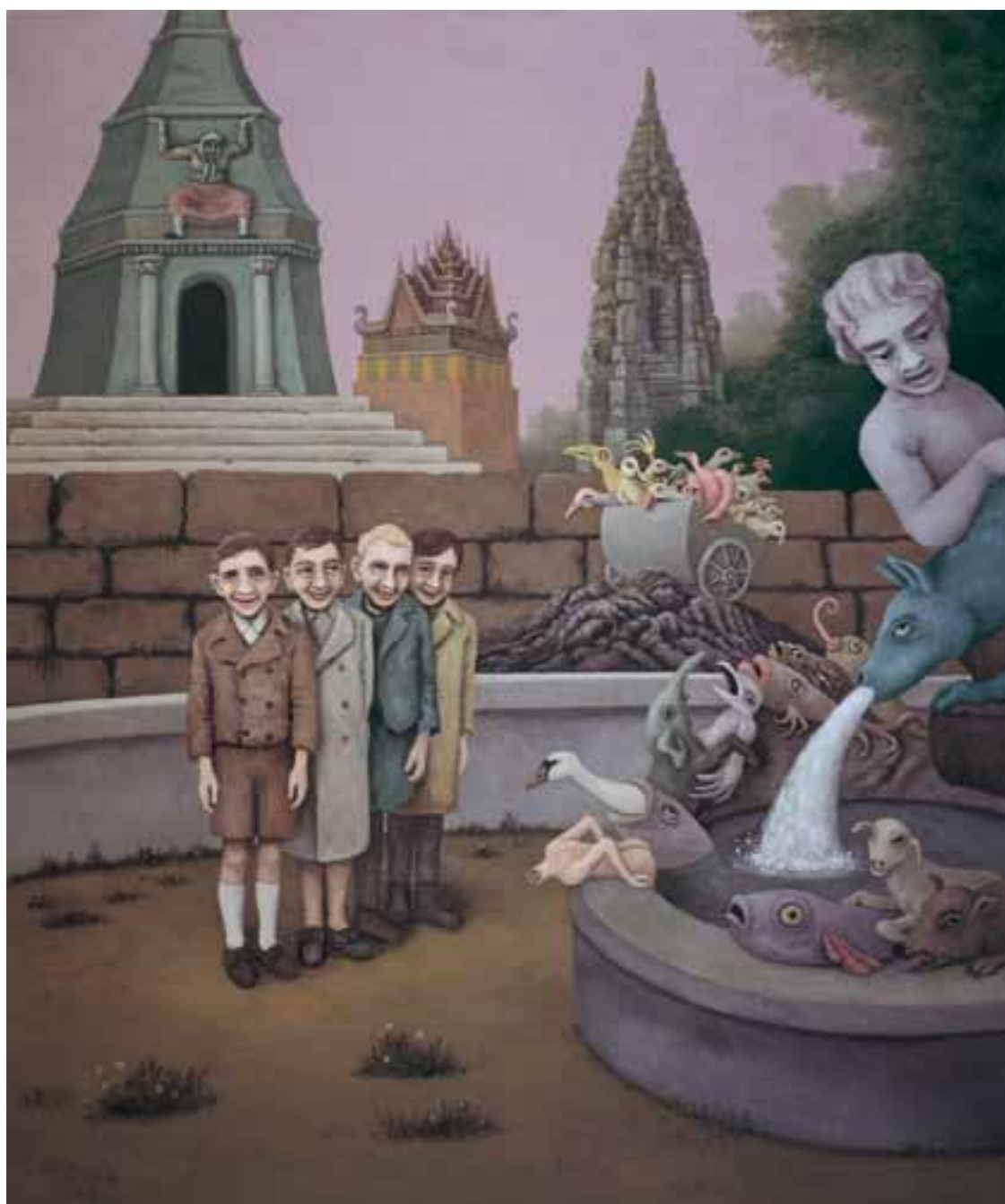
1. NÉGY KACAGÓ FIÚ 95 x 80 cm, 2005

T e tudtad, hogy a földkerekséget holtak népesítik be? A közelmúlt és a távolmúlt halottai. Időközben úgy hétmilliárdnyian vannak, árnyékok, minden idők halottai, a legelső homo sapiens től, kezdve attól, aki még be sem töltötte a tizennegyedik életévét, és nő volt, meg attól, aki a harmadikmifajtánkbeli születése után halt meg egészen tegnap elköltözött barátodig. Időközben több ember él a földön, mint amennyi valaha is elpusztult rajta. Ámbátor ma is gyilkoljuk egymást, s a vírusok sem adták még be a kulcsot. – A halottak úgy néznek ki, mint haláluk pillanatában. Az első holtak feketén és meztelenül járnak-kelnek, vagy éppenséggel pizsamában, bezúzott koponyával, levágott lábbal, haloványan, szalonkabátban, fejükön micisapkával vagy acélsisakkal. A lelkeket persze nem látjuk, de a figyelmesebbek némelykor érzékelik jelenlétüket, főleg, ha keresztülmegyünk egy olyanon, aki nem akar vagy nem tud kitérni előlünk. Miért is térne? Kicsit megborzongunk. Gyenge ellenállást éreztünk, enyhe dohszagot. – Állítólag a dolog úgy működik, hogy a világ összes