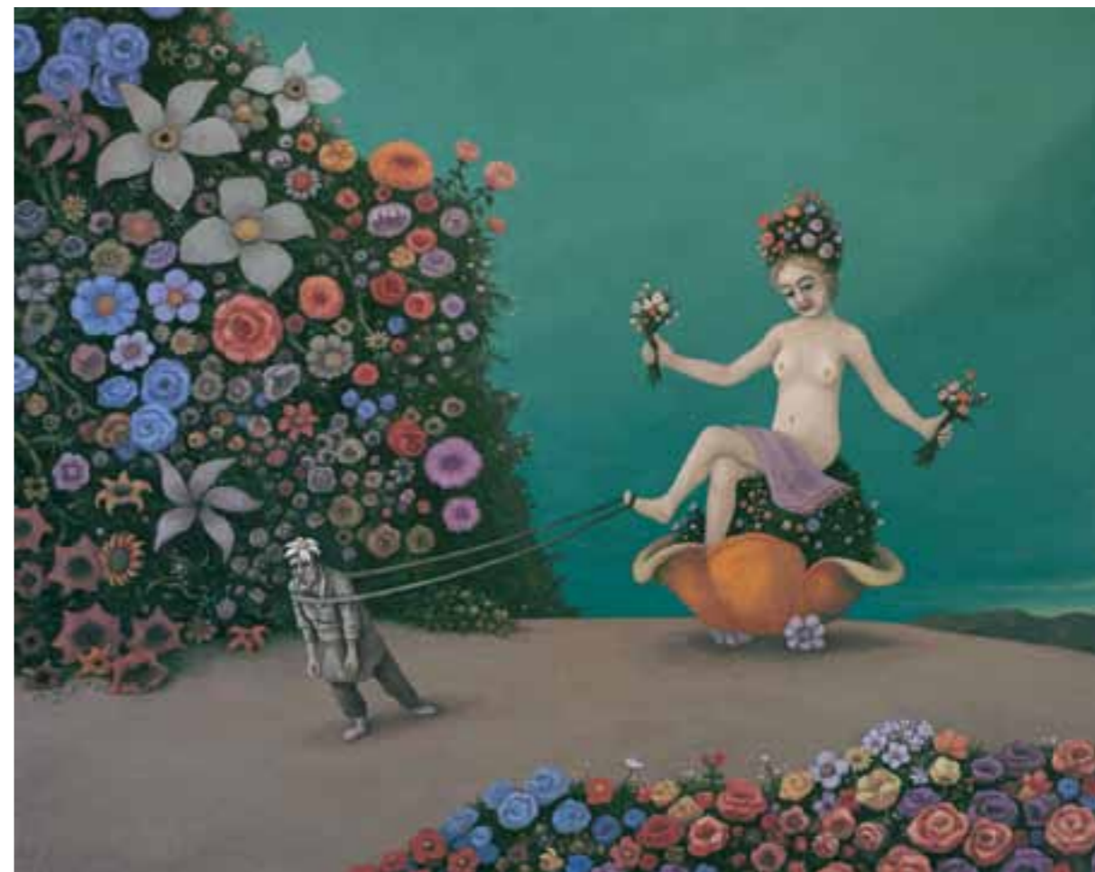
8. FLÓRA ASSZONY SÉTÁJA 75 x 95 cm, 2003