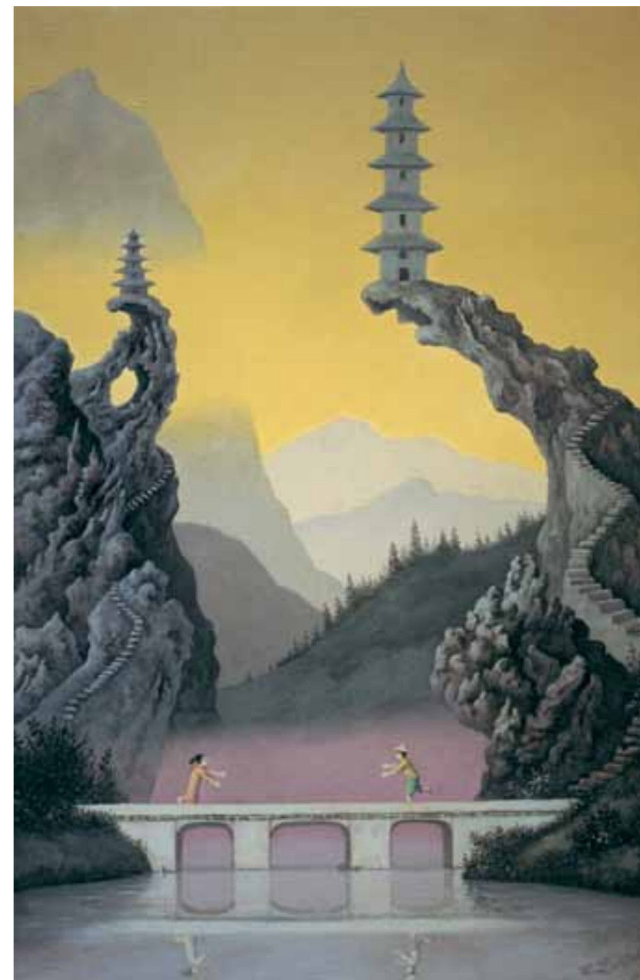
4. SZERELMESPÁR A HÍDON A RÉGI KÍNÁBAN 60 x 40 cm, 2005

...mert neki nincs emlékezete és nem ismeri a könnyeket. Természetesen néhány ár-apály idejére fennmarad még a nyomod, sápadt csípőcsontod talán, amelyet egy meg gondolatlan hullám kisodort valahová a partra, liánokkal benőtt BP-benzinkútszivattyú oszlopa alá, egy málló tévétoronyhoz, melynek árnyas gerendái alatt pézsmáökrök legelésznek, s az is lehetséges, hogy a napfénytől tenyérnyi távolságra, a parázsforró sivatagi homokban képek hevernek, ezeket a képeket, amelyek csak most keletkeztek (korábban csupán képcsírák voltak), senki sem látta, akár azokat a sivatagi rózsákat sem, amelyek csak egyszer nyílnak ezerévenként, a hőmérséklet, a nedvesség, a megszületés gyönyörének végre-valahára megadott irgalmából. Elvértve, ha rátalált egy tuareg, leszedett egy-egy sivatagi rózsát, és menyasszonyának ajándékozta. De mára eltűntek a tuaregek, és a menyasszonyok is. A képek láthatatlanok maradnak. Az emberi világ vége után keletkeztek, senki sem tudja hogyan. Okafogyott emlékezet. Ha egy gekkó netán mégis kikapar egy képet a földből – szerelmesek egy kínai hídon –, értetlenül áll majd előtte. A kép kellős közepén áll, de nincsen szeme látni. Világában ismeretlen a szerelem, ezt éppen most tapasztalja, ahogy pillanatnyi figyelmetlensége miatt felzabálja egy csorda szurikáta.