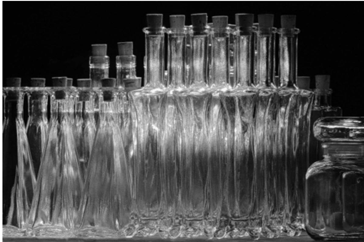
A szikrázó fényben életre kelnek...