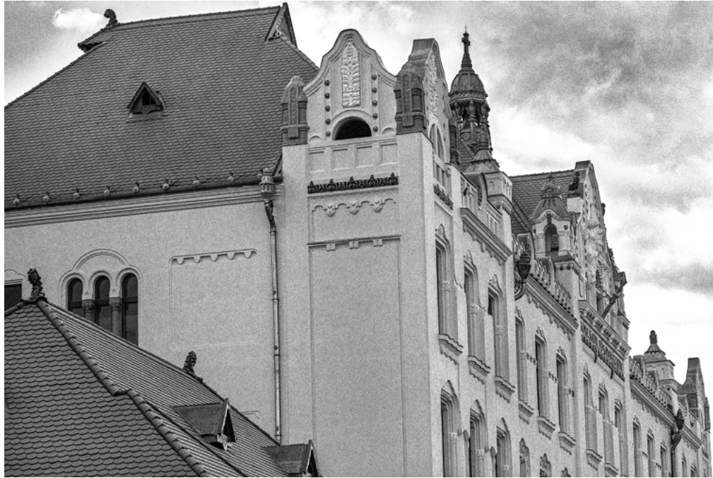
A Tamási Áron Gimnázium főépülete Clădirea principală a Liceului Tamási Áron The main building of Áron Tamási High School • 2020

Igaz, hogy „szuper reál” osztályba jártunk, de az nem igaz, hogy úgynevezett „szakbarbárok” lettünk volna. Érdekelt bennünket sok minden. Számomra azóta is kérdés, hogy kell-e szégyenkezni azért, amit akkor gondoltunk vagy cselekedtünk.