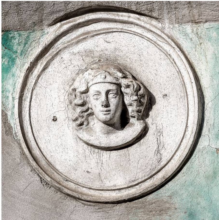
Az a bizonyos „parasztbarokk”, Szent Imre utca 33. szám Aşa-numitul „baroc țărănesc”, strada Sântimbru nr. 33 The so called “peasant baroque”, Szent Imre Street No. 33 • 2022

„Nem lett, mégse lett belőlem angyalka, tollsöprű-szárnyú, sztaniol-glóriás, gyolcspendelyes, herceg, kicsi édes...”