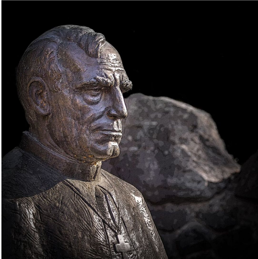
Márton Áron szobra vigyázza a várost Statuia lui Áron Márton veghează asupra oraşului The statue of Áron Márton watches over the city • 2022

alapuló fikció eredménye –, egészen kézzelfogható közelségbe került. A bolt kilincsenek érintése összekapcsolódott a fejemben a filmen látott Goldstein-lánnyal, és kegyetlen közelségbe hozta a történeteket. Már nem a film egyik szereplőjét láttam, hanem egy olyan embert, aki közülünk való, akármiükünk lehetett volna a helyében. Szívszorító történetekkel szembesültünk, és sok kérdés fogalmazódott meg a film közben... még több utána.