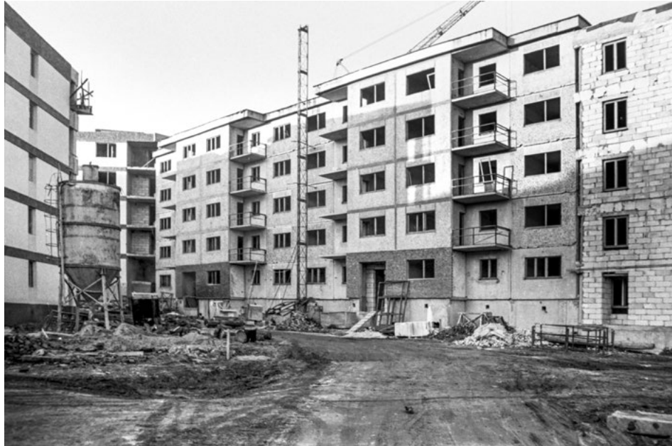
Épül a Bethlen negyed Construcția cartierului Beclean The Bethlen Quarter under construction • 1985