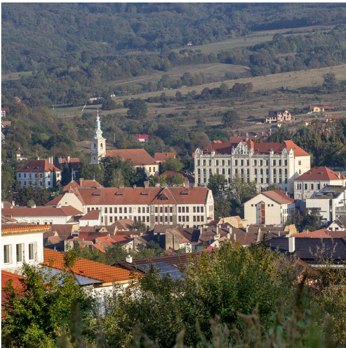
A város bejárata, úgy is mondhatnám, Európa felől. Bármikor hazaérkezünk, a gimnázium üdvözlő elsőként Întrarea în oraș, așa putea spune cea dinspre Europa. De fiecare dată când ajungem acasă liceul este cel care ne întâmpină primul The entrance to the city, I could say from the direction of Europe. Whenever we arrive home, the high school is the first to greet us • 2024

„Sétáltunk a városban, és közben megnéztük együtt Szemlér Ferenc barátunkkal a szülőházát, és arról beszélgettünk, hogy hova legyen majd elhelyezve az emléktábla...” 1974-ben vagy ’75-ben egy író-olvasó találkozó bevezetőjeként hangzott el ez a mondat, egy hazai irodalmi lap főszerkesztőjének szájából az udvarhelyi, akkor még élő Szemlér Ferenc költő jelenlétében, a székelyudvarhelyi Művelődési Ház koncerttermében.